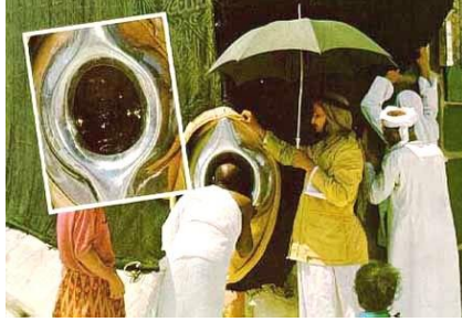
The Sacred Yoni of Sheba, The Goddess of Ka'ba, the Muslim Pilgrims kiss (references given here)

கா'பாவில் காணப்படும் புனித கருப்புக்கல் - 'பெண்கடவுள் ஷீபா'வின் பிறப்புறுப்பைக் குறிக்கும் 'யோனி' (yoni) என ஒரு படம் இங்கு கொடுக்கப்பட்டுள்ளது. அதன் மீது பெண்கள் அணியும் முக்காடும் உள்ளது. *↓இப்பெண்ணுறுப்பைத்தான் (Sacred Yoni of Sheba) 'ஹஜ்'ஐக்கு வரும் முஸ்லிம் யாத்திகரிகள் மரியாதையுடன் தொன்றுதொட்டு தங்கள் உதடுகளால் முத்தமிடுகிறார்கள்!